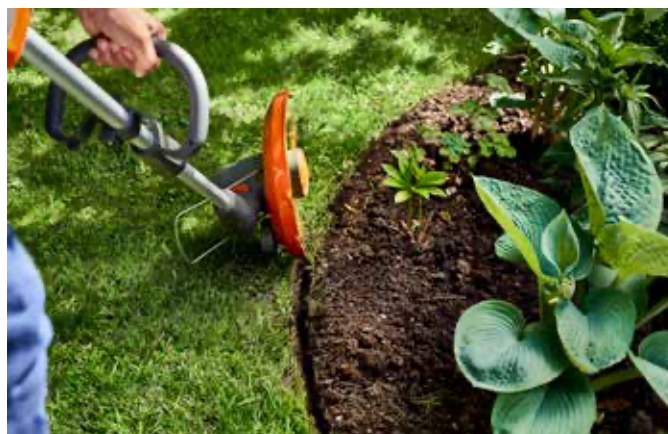
Husqvarna 110iL mit drehbarem Trimmerkopf und Kantenschneidfunktion